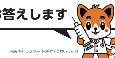
日医キャラクター「日医君(にちいくん)」